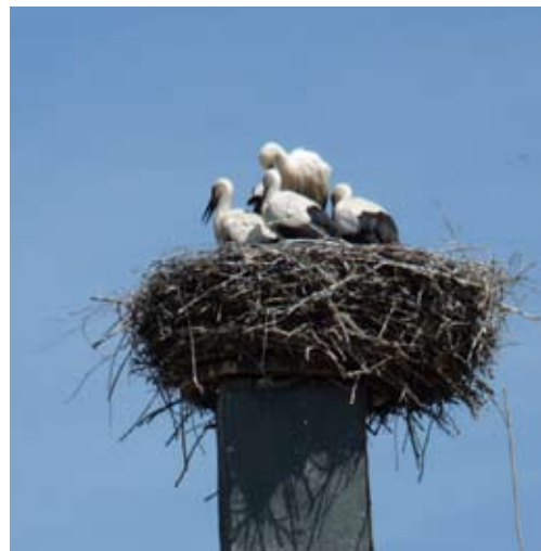
Čáp bílý zde patří k pravidelně hnízdicím druhům. Sčítání je díky jeho vazbě na lidská sídla poměrně jednoduché.

Pro mapování hnízdního rozšíření ptáků Frýdlantska je využívána kombinace výše uvedených metod. Ta byla dosud využita pouze na Třeboňsku. Tato metoda předpokládá, že celé území bude rozděleno na cca 140 mapovacích čtverců o ploše přibližně 2 km 2 . V každém čtverci je umístěno 10 sčítacích bodů. Na těchto bodech probíhají v hnízdní době dvě sčítání. Dále je v každém mapovacím čtverci provedeno mapování druhů obtížně zachytitelných výše uvedenou bodovou sčítací metodou. Jedná se zejména o sovy, dravce, chřástala polního a vodní ptáky. Tímto způsobem by měla být zachycena podstatná většina hnízdicích druhů, a to na poměrně husté síti čtverců, to znamená dostateč-