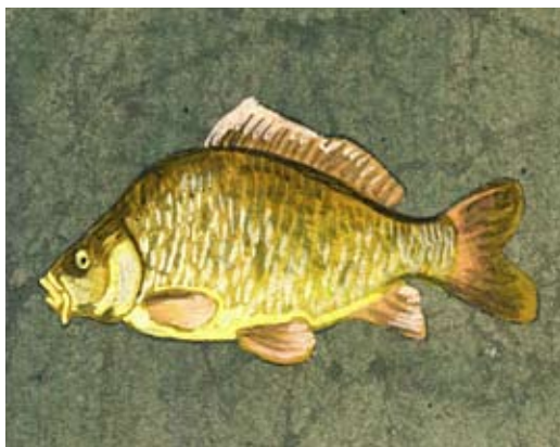
Ilustrace Tomáše Řízka z knihy Český rok od jara do zimy.

zásadní důležitosti, neboť symbolizovala díky velkému množství zrněk bohatství (především vzhledem k penězům), se řadila sladká prosná kaše nebo jahelník a třený mák s mlékem. Proto se proso udrželo ve svátečním jídelníčku všech významných dnů v roce, i když je ani chuť uzeleného, se kterým se později vařilo, neproměnila v oblíbený pokrm. Neodmyslitelnou součástí štedrovečerní tabule zůstala dodnes vánočka z kynutého těsta a jablečný závin.