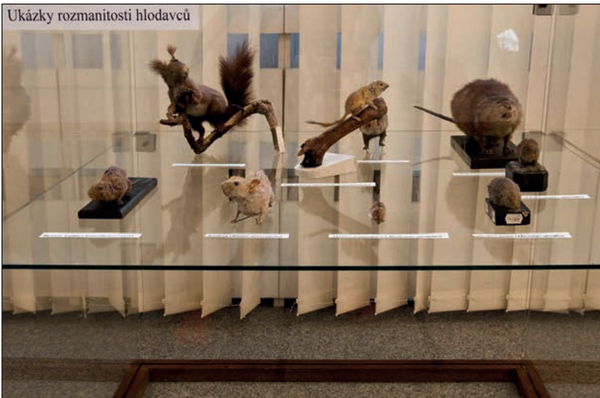
Výstava Neznámý svět drobných savců (únor 2011)