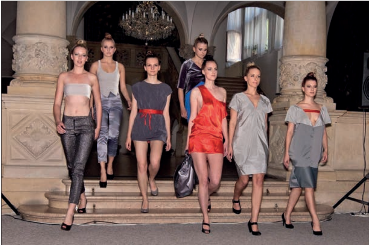
Módní přehlídka – vernisáž výstavy Bakalaureáty 2011 (květen 2011)