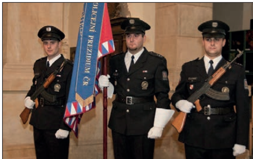
Ocenění policistů, obč. zaměstnanců a prac. složek IZS (říjen 2011)