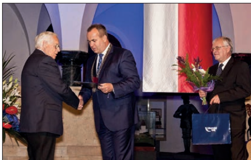
Slavnostní večer hejtmána LK – předávání ocenění (říjen 2011)