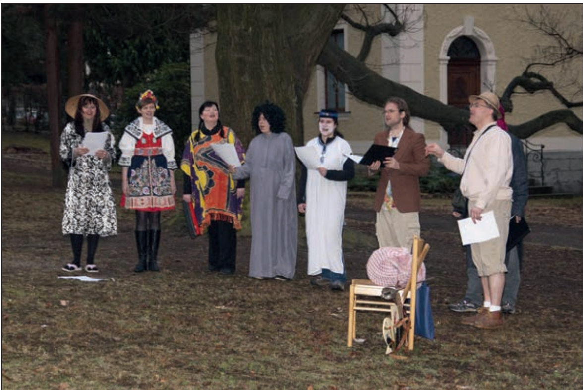
Záběr z parku za muzeem – tradiční Aprílové zpívání (březen 2011)