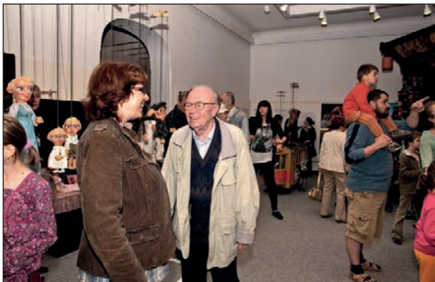
Záběry z výstavy Loutky z Naivního divadla Liberec (červen 2011)