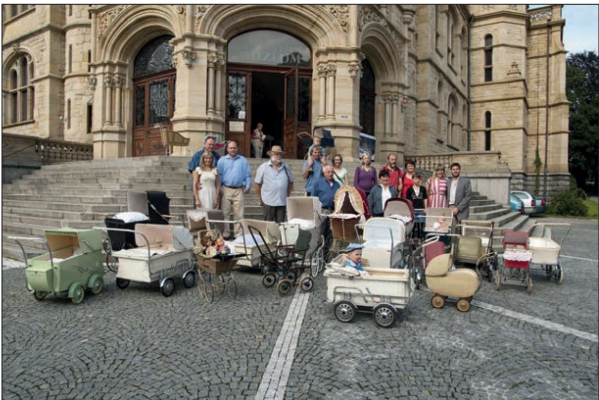
Přehlídka historických kočárků před budovou muzea – akce Kočárkový veterán (srpen 2011)