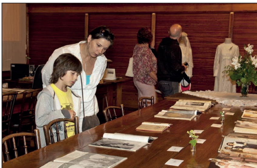
Muzejní noc – program pro veřejnost v knihovně SM (červen 2011)