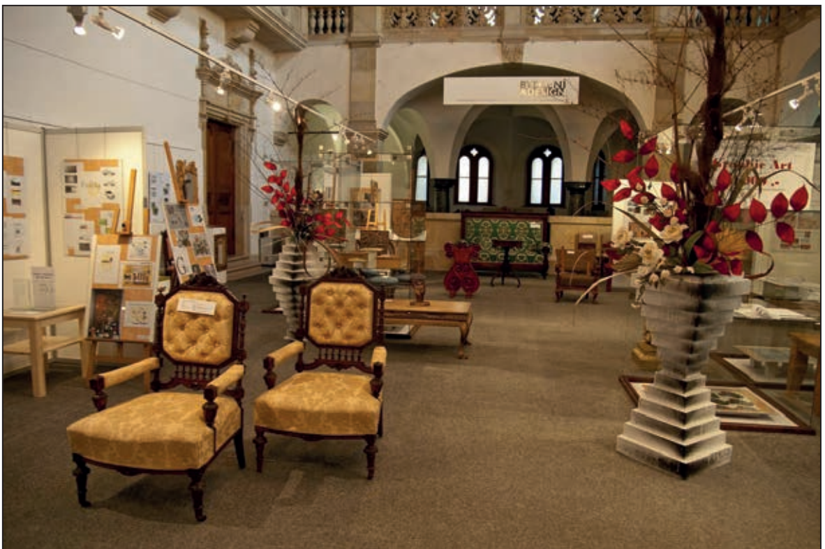
Bydlení a design 2011 (červen 2011)