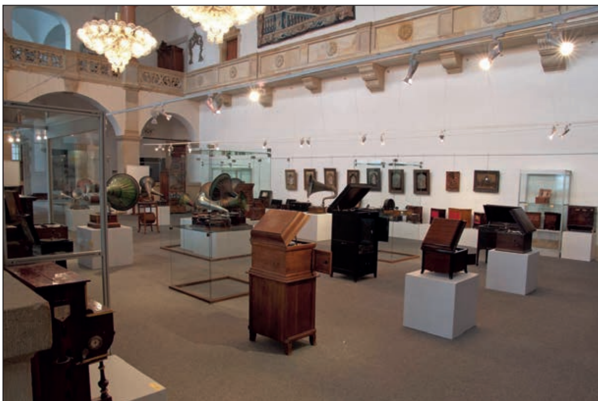
Výstava Neslýcháno nevidáno – hudební automaty, stroje a strojky (únor 2011)