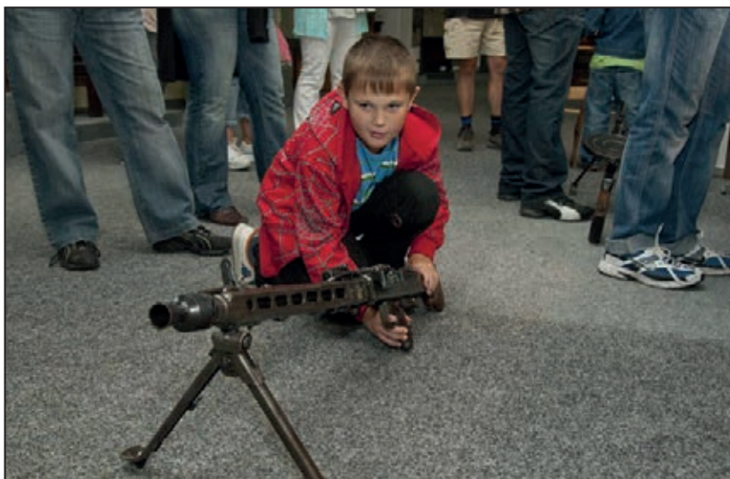
Dny Evropského kulturního dědictví – EHD (září 2011)