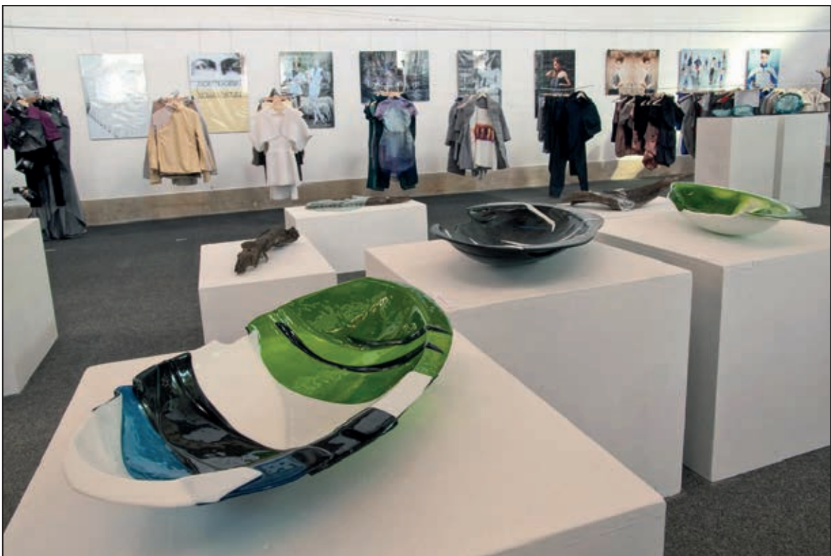
Z výstavy Bakalaureáty 2011 (květen 2011)