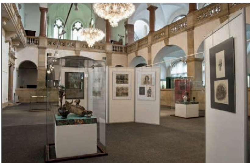
Záběr z výstavy (Ne)praktický kabinet Jiřího Wintera (září 2011)