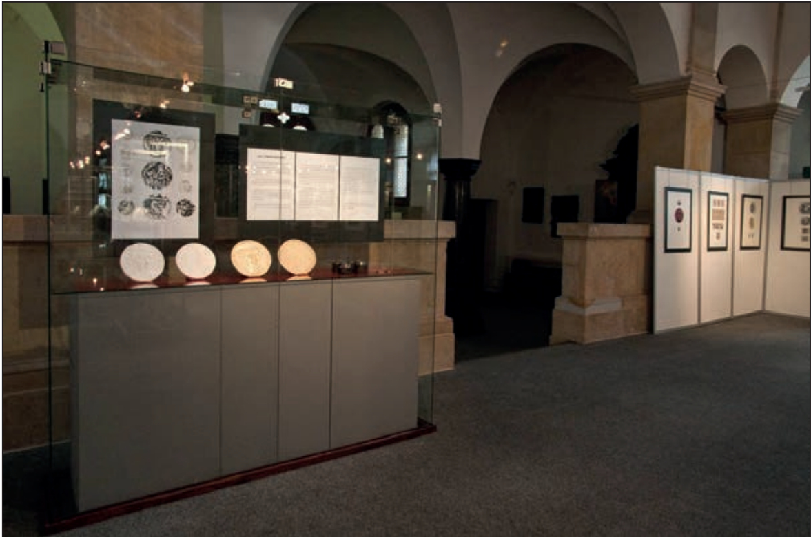
Záběr z výstavy Jablonecká medailérská škola (leden 2011)