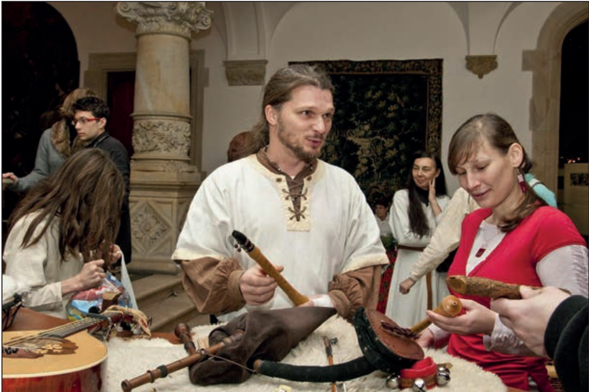
Adventní neděle v Severočeském muzeu (prosinec 2011)