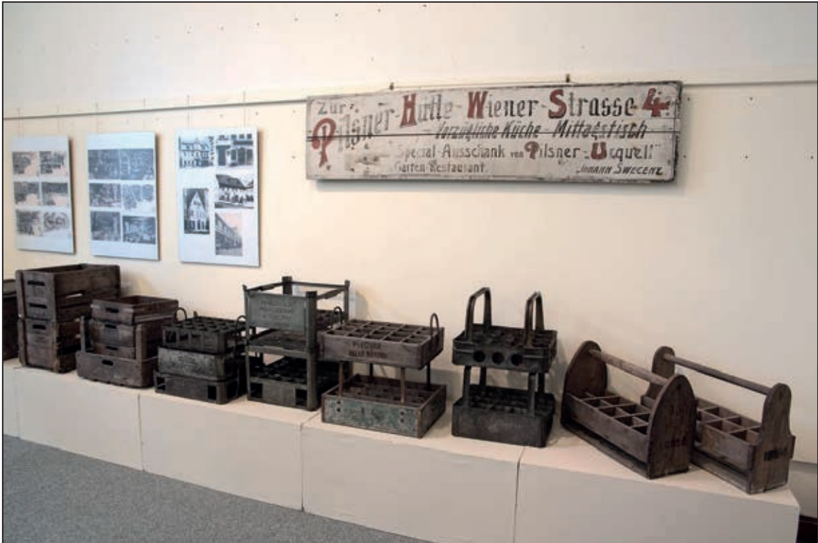
Letem světem piva (březen 2011)