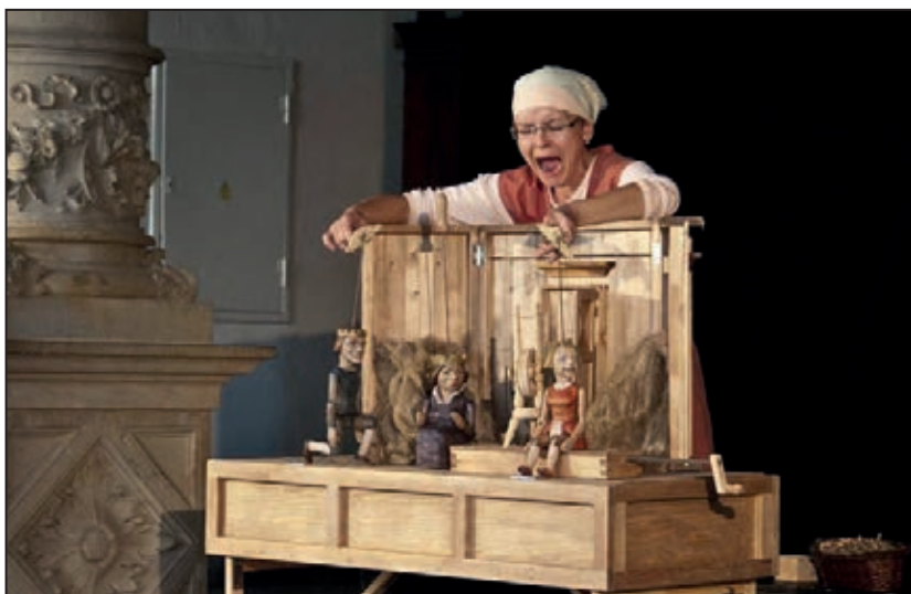
Divadelní představení Tři přadleny (září 2011)