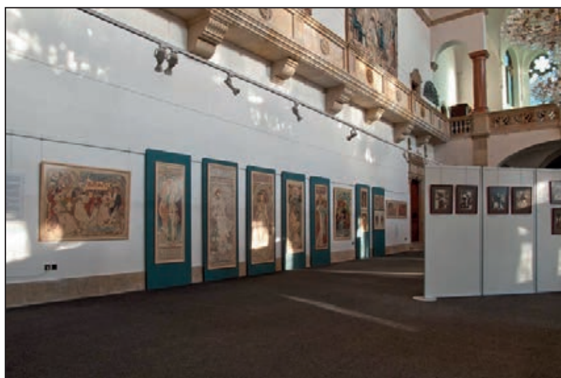
Výstava Alfons Mucha – Fotografie z ateliéru (listopad 2011)