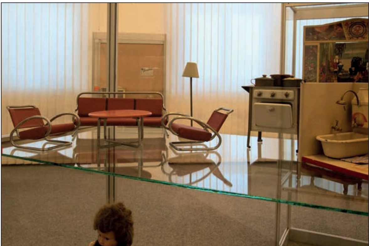
Exponáty na výstavě Kouzlo hraček (leden 2011)