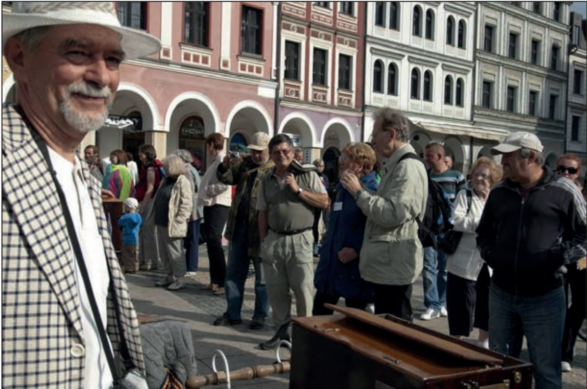
II. mezinárodní setkání flašinetářů Liberec 2011 – účastníci na nám. Dr. E. Beneše (srpen 2011)