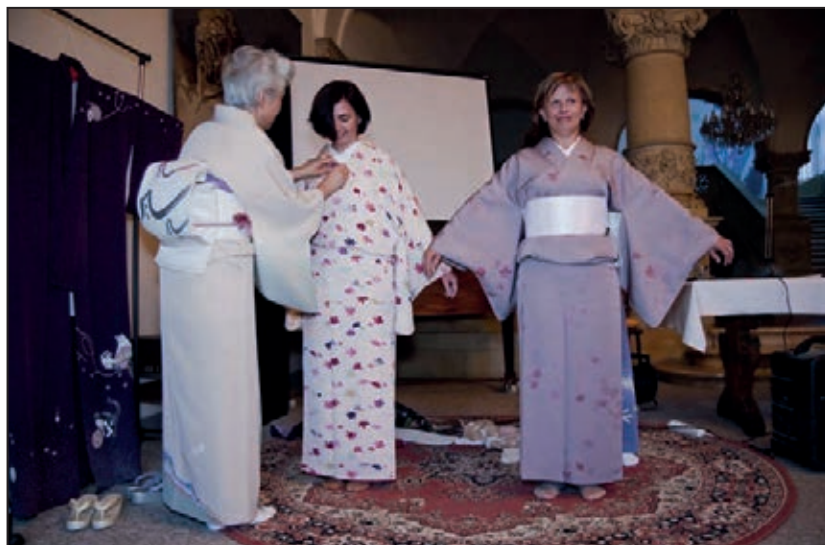
Podzim s Japonskou kulturou v SM (září 2011)