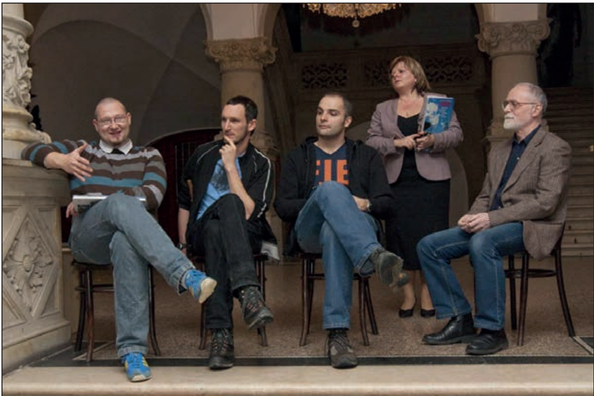
Záběr ze křtu knihy J. Zemana „Liberec – urbanismus, architektura, industriál, pomníky, objekty, památky“ ve slavnostním vestibulu muzea (prosinec 2011)