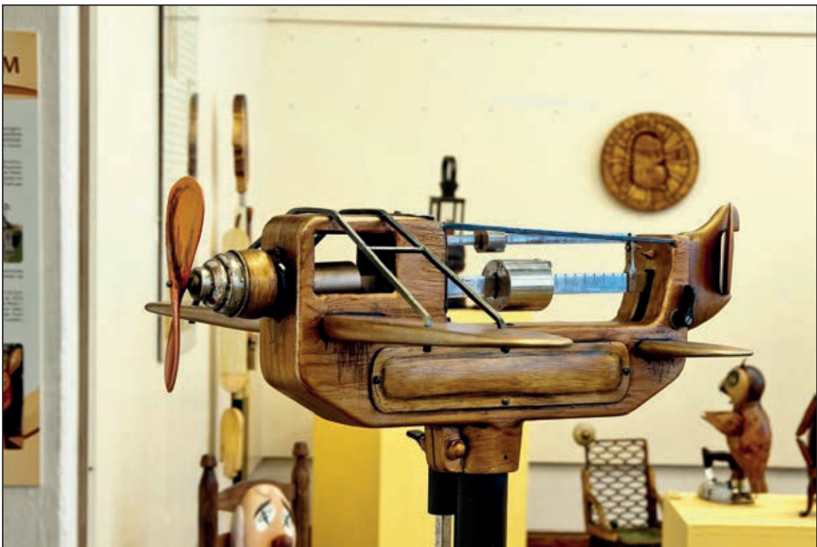
Jeden z mnoha podivných objektů na výstavě Dřevošrot Zdeňka Viléma (listopad 2011)