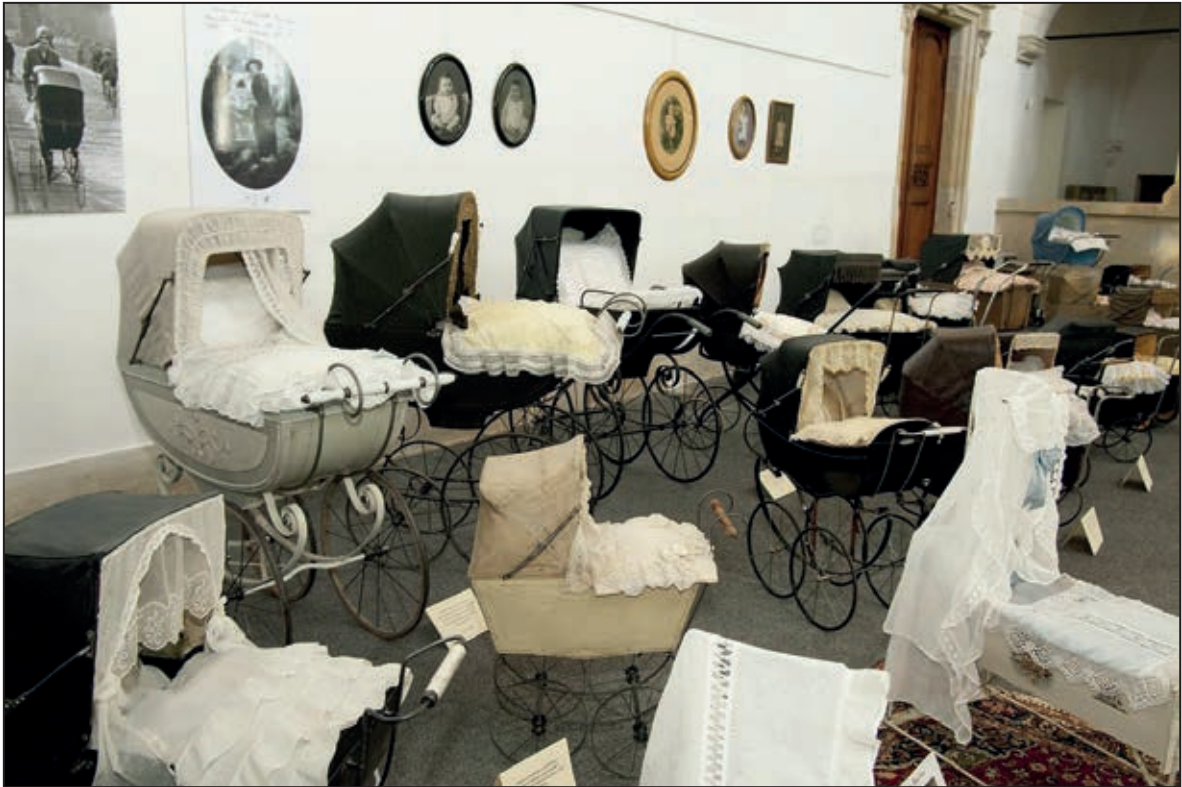
Výstava Historické kolébky a kočárky (červen 2011)