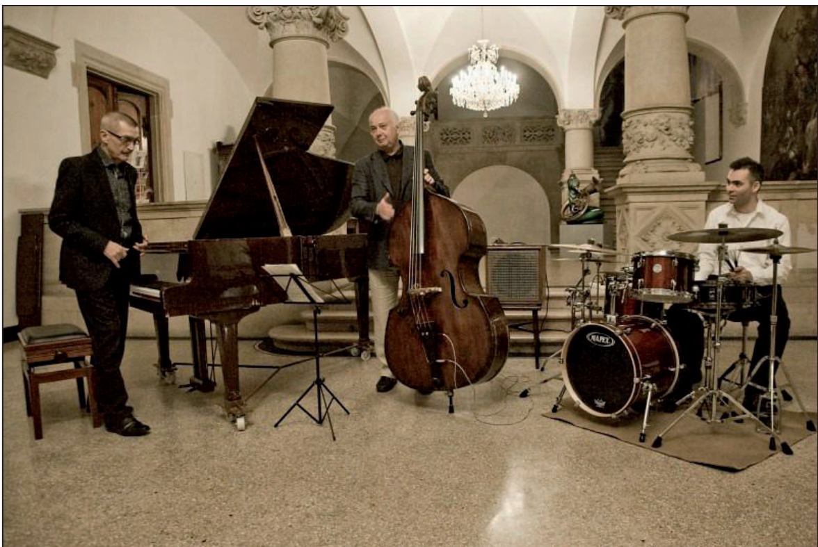
Koncert Tria Emila Viklického (duben 2012)