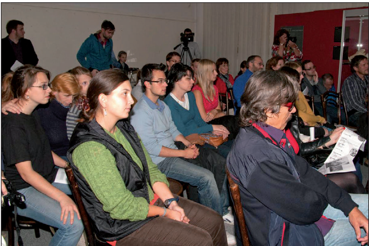
Literatour – Literární procházka Libercem „s pistolí v zádech“ (říjen 2012)