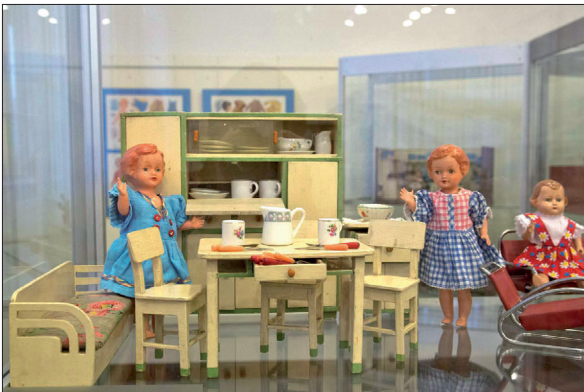
Z výstavy Pokojíčky pro panenky v proměnách času (prosinec 2012)