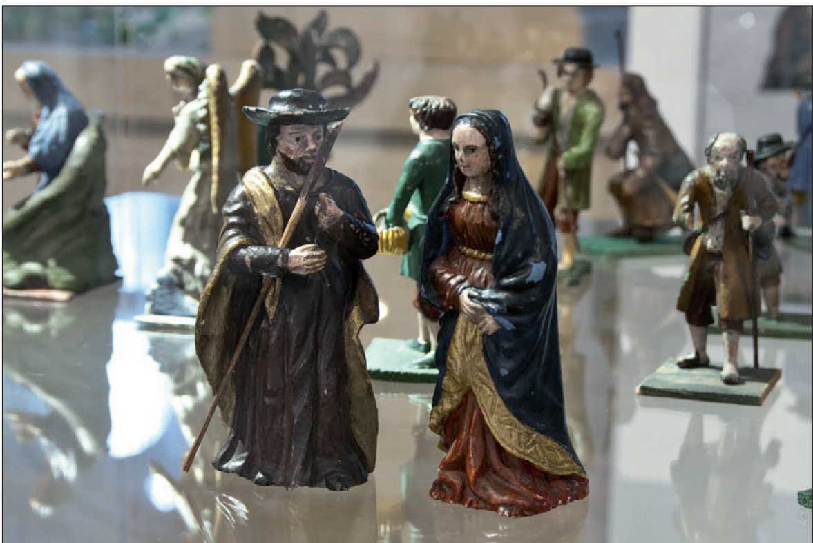
Záběr z předvánoční výstavy Nám, nám narodil se! (listopad 2012)