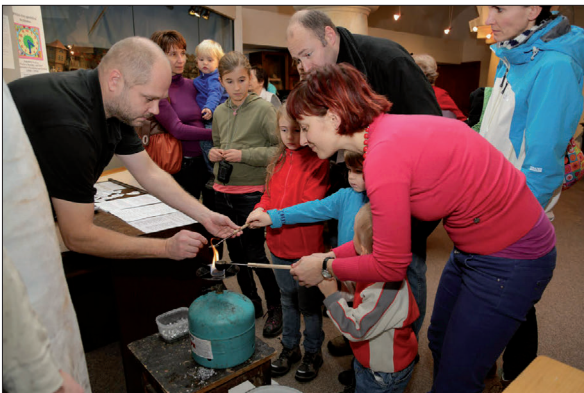
Lití olova na adventní akci Půjdem spolu do Betléma (prosinec 2012)