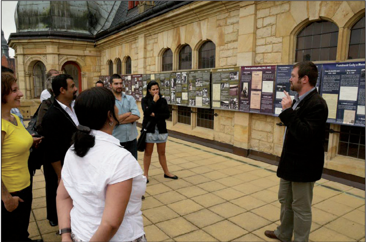
Genocida Romů v době druhé světové války – panelová výstava na terase SM (červen 2012)