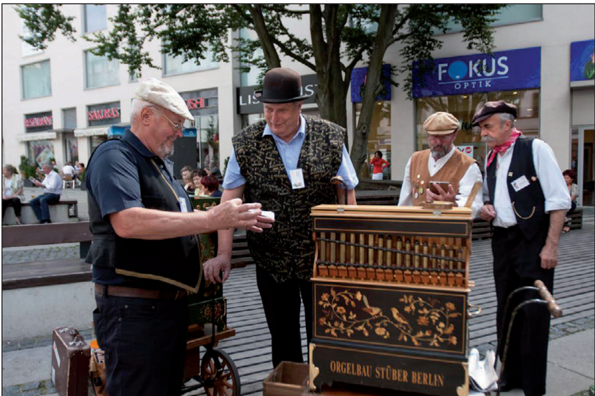
...tak i v ulicích města Liberce (srpen 2012)