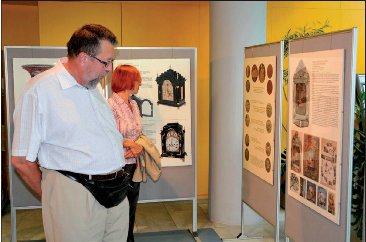
Výstava Zachráněné poklady Severočeského muzea v budově Krajského úřadu LK (září 2012)