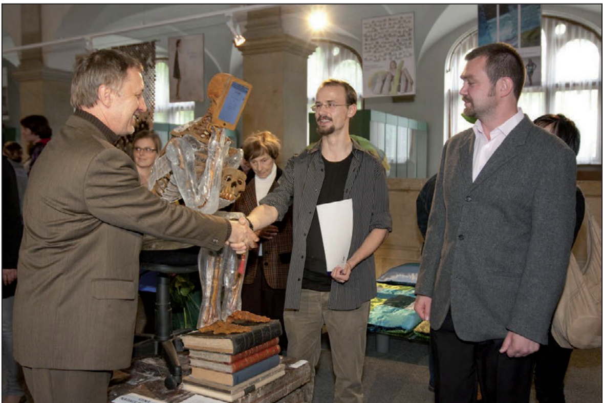
Předávání ocenění na výstavě studentských prací Bakalaureáty 2012 (květen 2012)