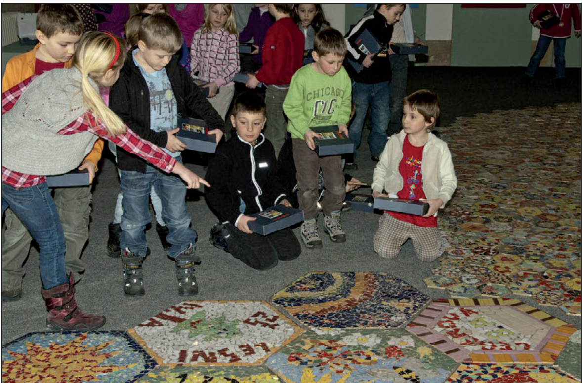
Výstava Loukamosaic – doprovodné výtvarné dílny pro děti (únor 2012)