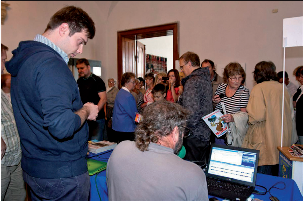
Improvizované studio Českého rozhlasu v rámci Dnů evropského dědictví (září 2012)