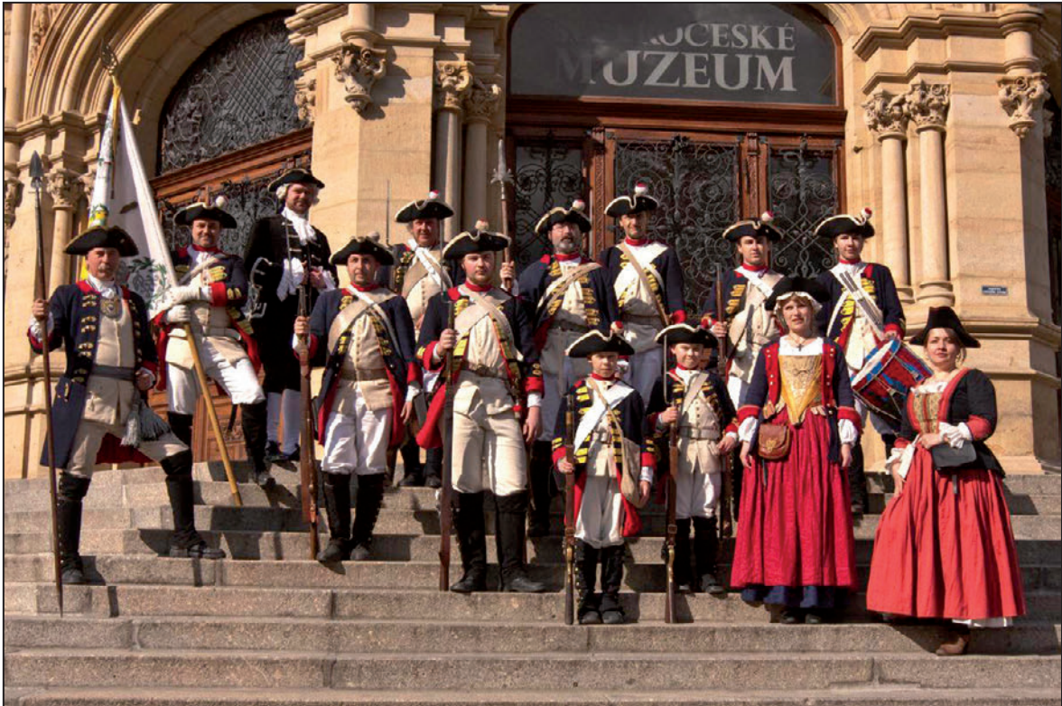
Účastníci akce Výročí bitvy u Liberce před budovou SM (duben 2012)