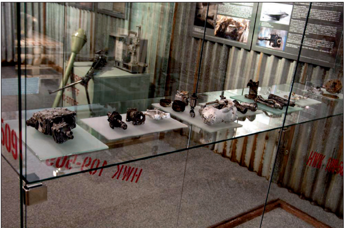
Exponáty na výstavě Industriál války (červen 2012)