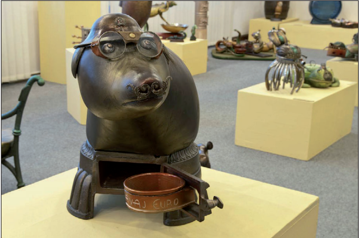
Z výstavy Dřevošrot Zdeňka Viléma (leden 2012)