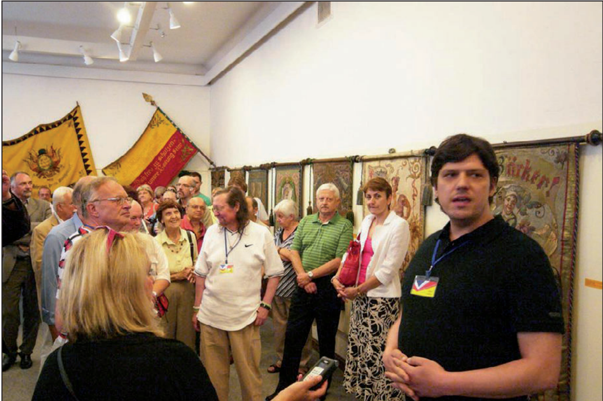
Vernisáž výstavy Prapory a vlajky ve sbírkách SM (červen 2012)