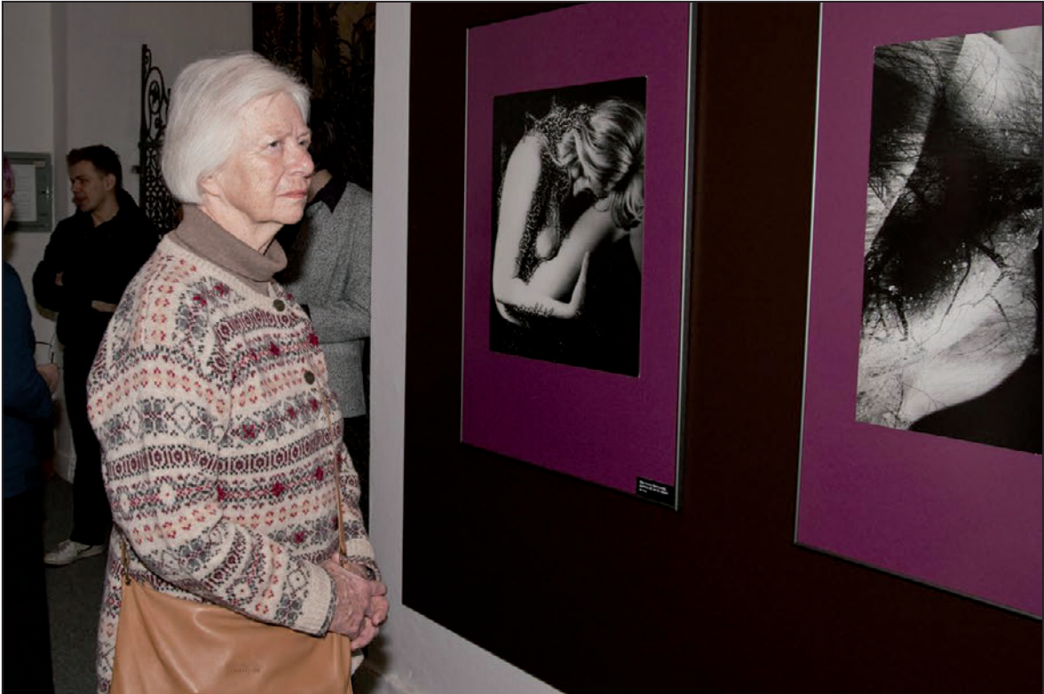
Slavnostní otevření expozice Kabinetu fotografie (březen 2012)