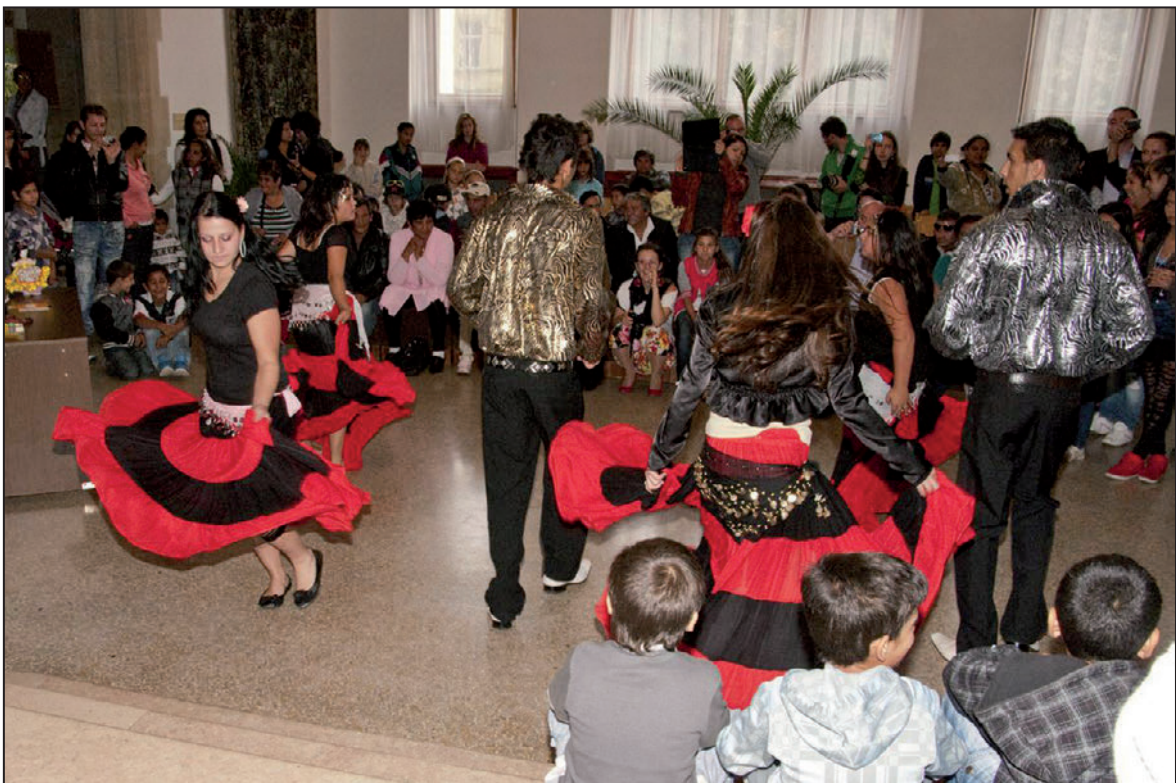
Den romské kultury v Severočeském muzeu v Liberci (září 2012)