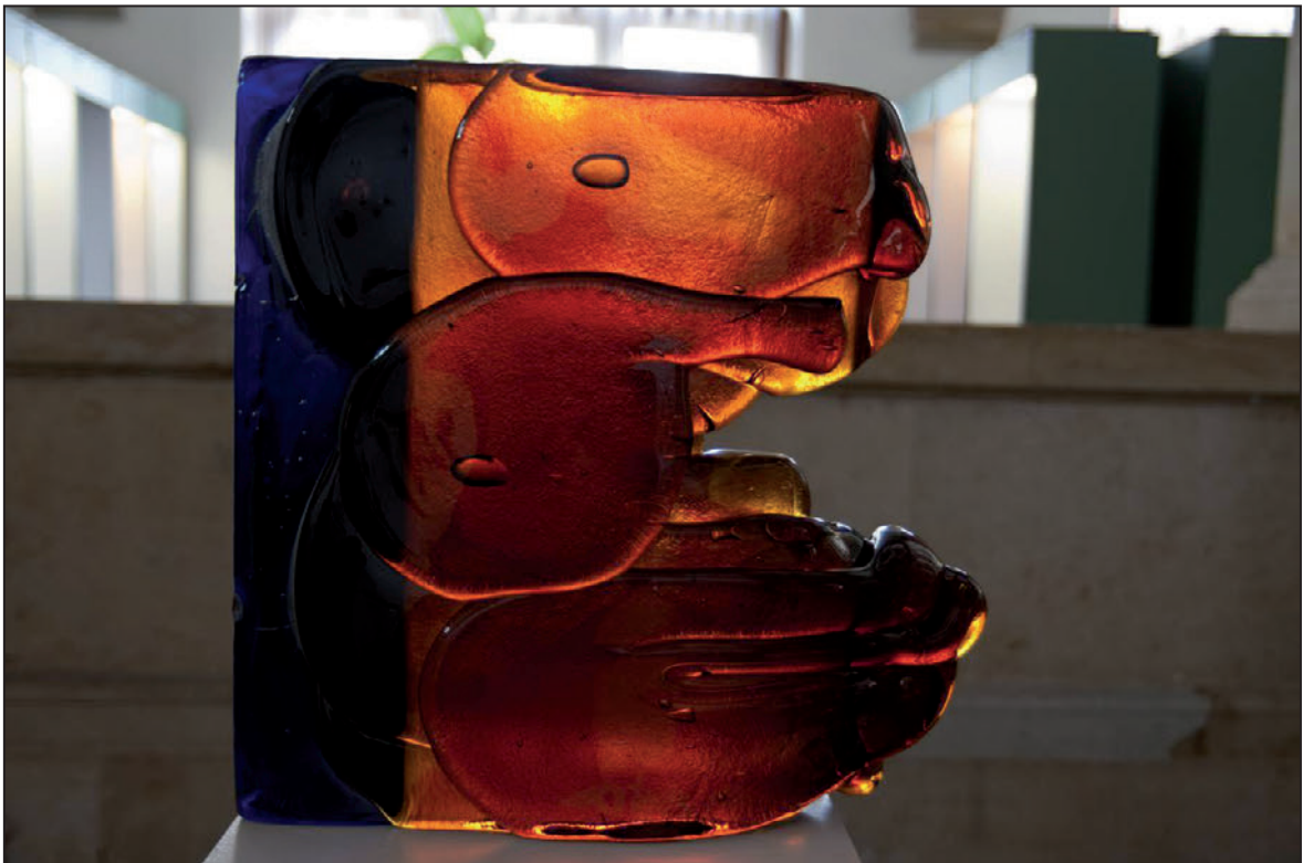
Exponát na výstavě Pavel Werner / Sklo / Kresba (září 2012)