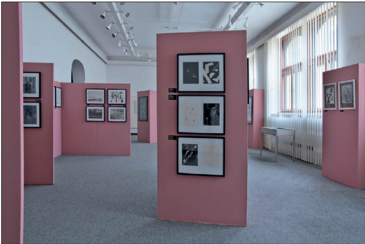
Z výstavy Studio výtvarné fotografie (duben 2012)