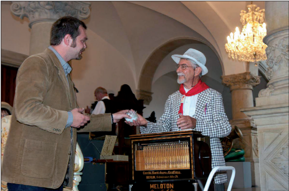
Další ročník festivalu Liberecký flašinetář probíhal jak uvnitř budovy Severočeského muzea...