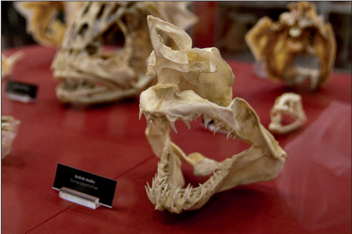
Lebka žraloka na výstavě Lebky, skryté umění přírody (září 2012)