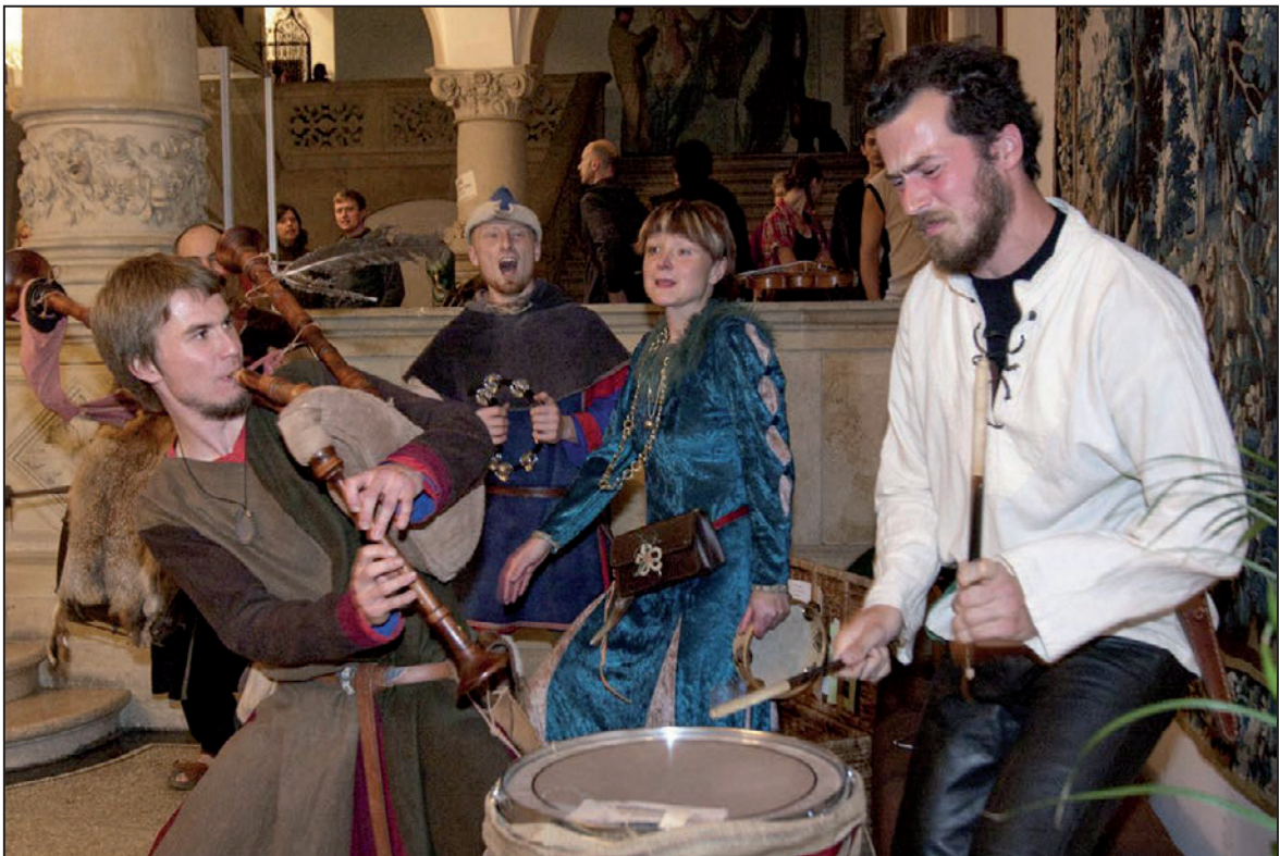
Vystoupení muzikantů na Muzejní noci 2012 (červen 2012)