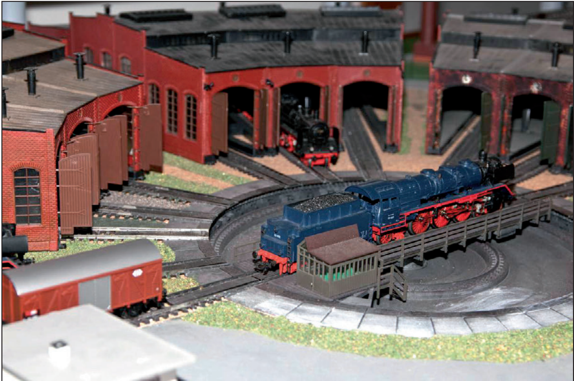
Detail obřího modelu kolejiště na výstavě Školáci staví železnici (říjen 2012)