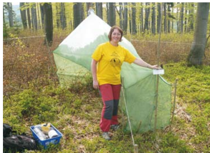
Instalace tzv. Malaiseho pasti k odchytu hmyzu pro vědecké účely ve staré bučině v Jizerských horách, květen 2011.

Severočeské muzeum v souvislosti s děním v letech 1938 až 1945 v tzv. Říšské župě Sudyty připravuje přehledovou výstavu, zabývající se zhruba 40 pobočkami koncentračních táborů Flossenbürg, Groß-Rosen, Osvětim a Ravensbrück na území České republiky v pohraničním pásu od Sokolovska po Bruntálsko a jednotlivě v Brně, v okolí Prahy a v jihozápadních Čechách, včetně pobočných koncentračních táborů na Jablonecku a Liberecku – v Rýnovicích, Rychnově u Jablonce nad Nisou, Smržovce a Chrastavě. Výstava se bude konat v termínu 25. října až 4. prosince 2011.