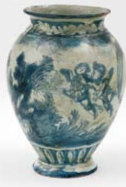
Váza, fajáns, modře malovaný dekor, Itálie, 17. století, PK 541.

Až na vázu s italskou krajinou se jedná o exponáty, které jsou součástí stále uměleckohistorické expozice Severočeského muzea v Liberci. Návštěvníci však nebudou při prohlídce muzejních expozic nijak ochuzeni. Po dobu přechodné prezentace na výstavě Správy Pražského hradu nahrazují zmiňované zápůjčky neméně významné umělecké předměty. Za urbskou mísu je vystaven skvělý majolikový talíř se znakem florentské rodiny Salviati. Pochází z let 1545–1550 rovněž z Urbina, a to z dílny Quido Fontany. Talíř patří do rozsáhlého servisu, jehož jednotlivé části jsou dnes roztroušeny