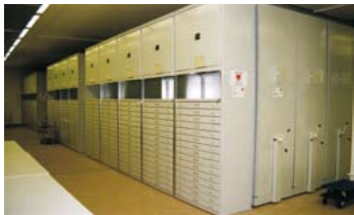
Sbírkové předměty v podzemním depozitáři jsou uloženy v pojezdových regálech nebo fixních šuplíkových skříních.

tento rok se podařilo získat významnou finanční injekci na již třetím rokem probíhající rekonstrukci barokního kláštera v Hejnicích, který byl tehdy ve vlastnictví muzea. Na základě restitučního zákona však musel být rekonstruovaný klášter v závěru roku vrácen původním vlastníkům, Řádu menších