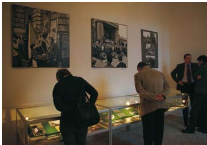
Zahájení výstavy Inwazja na Czechoslowacjie w 1968 r. – Karkonosze, Góry Iżerskie i Północno-Wschodnie Czechy, Archiwum państwowe, Wrocław – Oddział w Jeleniej Górze, 2. 12. 2008.

I přes tento pokrok nám v dokumentaci událostí souvisejících s rokem 1968 zůstávají mnohé mezery. Zejména pro období následujícího roku a počátku normalizace nám chybí doklady. Do budoucna bychom proto rádi doplnili zatím velmi skromný soubor vzpomínek těch, kteří jsou ochotni se o své osobní prožitky podělit a zaznamenat je pro budoucnost.