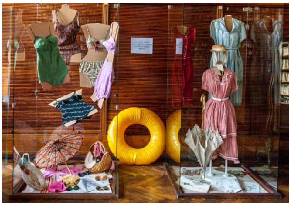
Koupací úbory a doplňky z depozitáře textilu vystavené v knihovně při příležitosti Muzejní noci.

vytvořit si návrh na plavky a slunečník ve formě letního „přáníčka“. Inspiraci k navrhování mohli návštěvníci nalézt na obrázcích v dobových časopisech a na fotografiích. ■