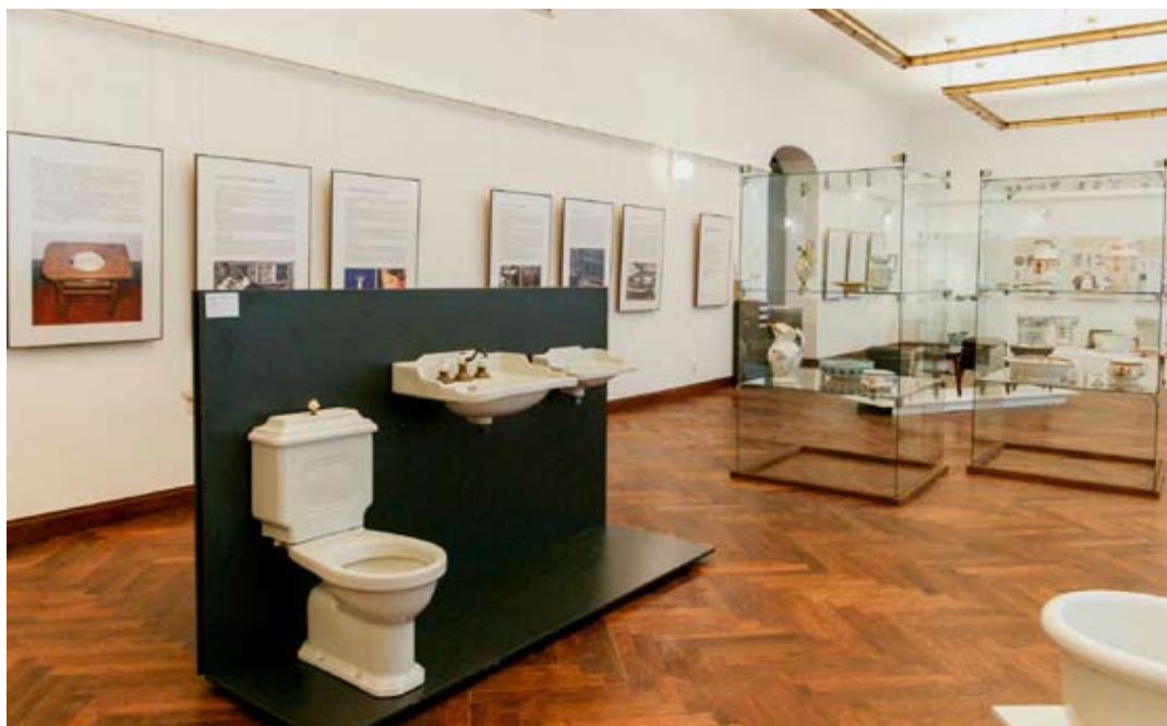
Královské posezení, první výstava ve zrekonstruovaném malém výstavním sále, potrvá do 28. září.