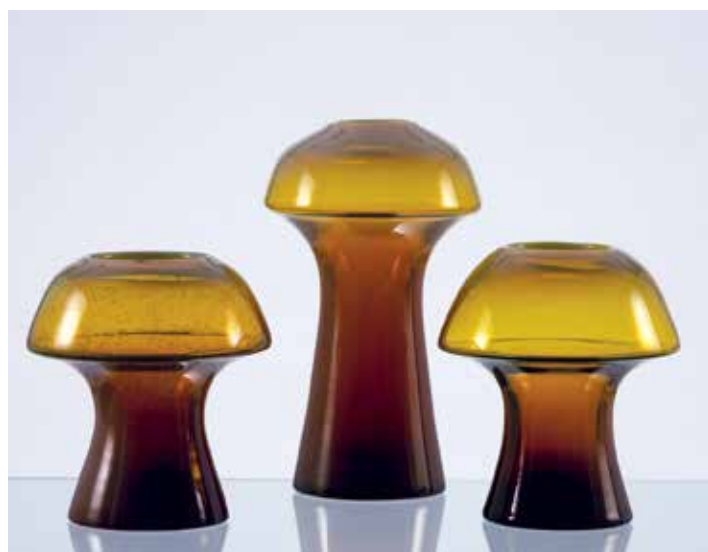
TŘI VÁZY FUNGI , Zbygniew Horbowy, Polanica Zdroj, hutně tvarované sklo, 1985, výšky 26 cm, 17 cm, 16 cm

Výběr konkrétních exponátů pro výstavu v Severočeském muzeu proběhl na základě vzájemných konzultací s uměleckými pedagogy Akademie a zahrnuje komorní výběr prací 42 autorů z let 1957–2002. Jedná se o skleněné a keramické soupravy nejrůznějšího