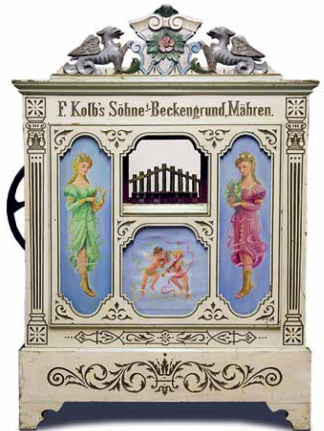
Celkový pohled na dvou mužný kolovrátek; sbírka hudebních automatů, Technické muzeum v Brně; v případě tohoto velkého kolovrátku můžeme říci, že se zde jedná o malé varhany s mechanickou trakturou a zásuvkovou vzdušnicí, kde manuál (klaviaturu) nahrazuje programový válec se snímací lištou

— *Klasické varhany mají velký tónový rozsah zahrnující prakticky celý okruh pro člověka slyšitelných tónů. Označení délky píšťaly ve stopách (32 cm) udává polohu, kde se v celém tónovém spektru rejstřík (řada píšťal) nachází. #