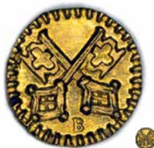
1/32 dukátu s hmotností 0,12 gramu je nejmenší zlatá mince všech dob ražená ve dvou typech v německém svobodném městě Řezně v roce 1750