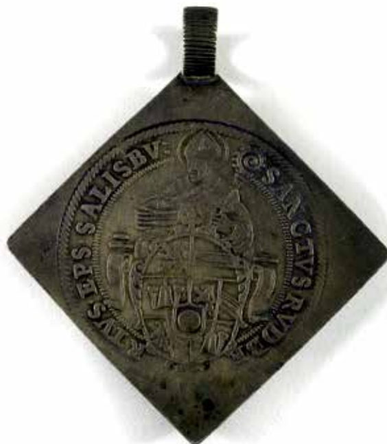
Mezi pozoruhodné mince numismatické sbírky patří takzvaný tolar s věží, který byl ražen v Solnohradsku za vlády Wolfa Dietricha z Raitenau