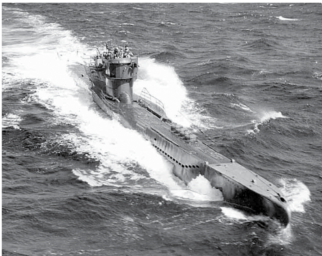
Ponorka typu VIIC

Pohřešování členové posádky byly prohlášeny za mrtvé až v březnu 1942, ale ani členové rodin ani představitelé města nebyli předtím dostatečně informováni. V průběhu ledna a února se dotazovali na osud posádky dokonce i v loděnici. Na rozdíl od spuštění na vodu potopení U-206 nebylo v místních novinách ani zmíněno. Na dně Atlantského oceánu na dosud neznámém místě leží potopená ponorka se znakem Liberce na věži a uvnitř se pomalu rozpadají kroniky města, obrázkové mapy, dopisy a fotografie z Liberce. #