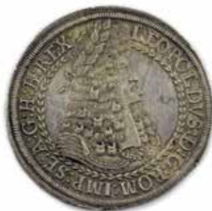
Sběratelsky zajímavou mincí je dvoutolar Leopolda I. ražený mincovnou Hall v Tyrolsku; zachovalý a poměrně raritní kousek