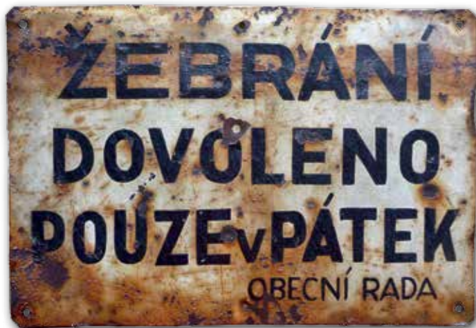
Cedule omezující činnost kolovrátkářů na určité dny v týdnu; historická podsběrka Vlastivědného muzea v Šumperku

V druhé polovině 19. století se žebrota pomocí kolovrátku natolik rozmohla, že příslušné úřady musey vydávaly vyhlášky a nařízení, které upravovaly, kde a v jakou denní dobu je povoleno tuto činnost provozovat. S velkou pravděpodobností za to částečně mohla i prusko-rakouská válka, kdy v jejím průběhu a po skončení přibývalo velké množství válečných invalidů. Připočteme-li k tomu kolovrátek jako hudební doprovod kramářských písní a různých kejklířů, byla velká pravděpodobnost, že se s jeho produkcí setkáte doslova na každém rohu. To mělo za následek vytlačování klasických hudebníků z ulic a veřejných prostranství,