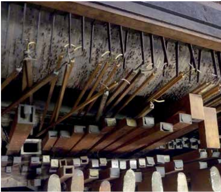
Pohled do píšťaliště a hřebíčkový válec velkého kolovrátku F. KOLB'S SÖHNE