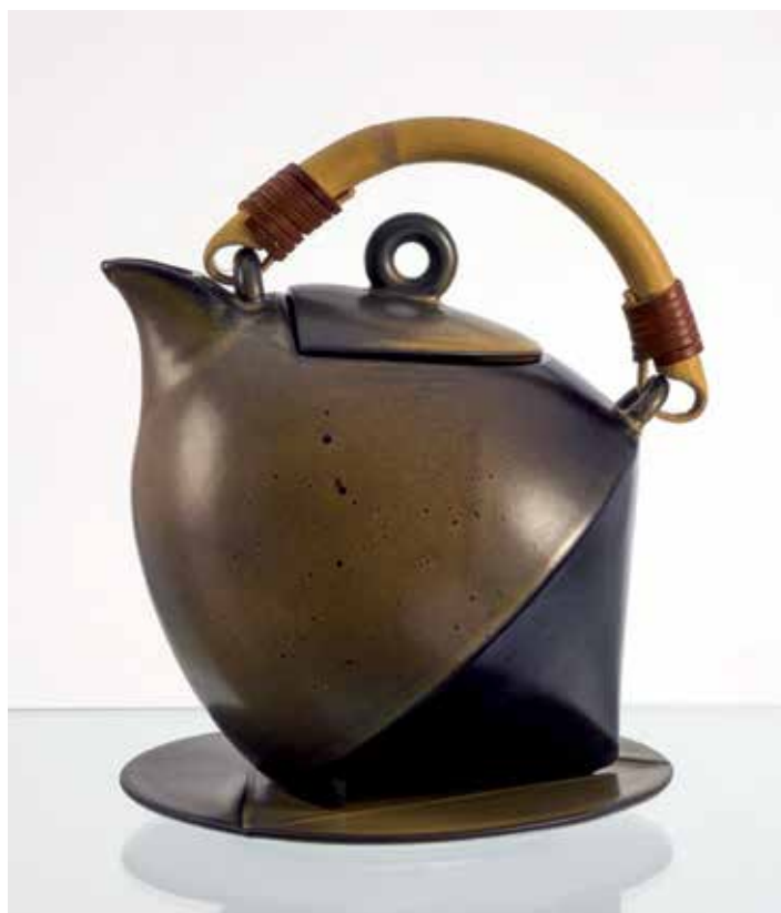
KONVICE NA KÁVU , Piotr Kołomanski, Magdalena Kołomska, Vratislav, pálená hlína, bambus, kůže, 1995, výška 24 cm

typu (kávové, čajové, nápojové, stolní), vázy, závěsné talíře, dózy a podobně, ale rovněž o volné autorské plastiky a dekorativní předměty. Výstavní soubor doplňují doprovodné texty o historii Akademie a jejich